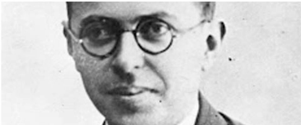
Jean Paúl Sarte. París, Francia 21 de Junio de 1905 – 15 de Abril de 1980

Inmediatamente después de la segunda guerra mundial, el panorama cultural francés se ve dominado por la figura de Sartre y por el existencialismo, la corriente de pensamiento que él contribuyó a difundir a través de su obra de filósofo y escritor, y de su engagement o compromiso político-cultural.