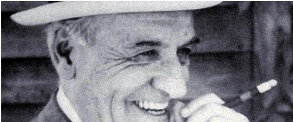
José Ortega y Gasset (1883-1955)

Se ha dicho que la historia de la filosofía Occidental no es más que una serie de notas a pie de página de las obras de Platón y Aristóteles. Y, ciertamente, maestro y discípulo inauguraron dos líneas de pensamiento alrededor de las cuales, con infinidad de matices, han ido pivotando las ideas centrales de los grandes pensadores de todas las épocas.