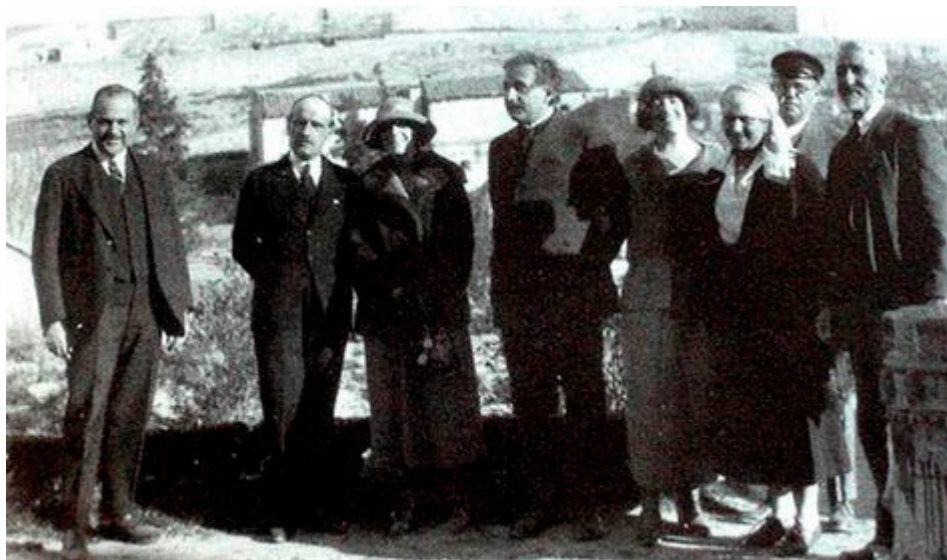
Ortega con Einstein en Toledo

Pero no pensemos que estamos hablando solamente de una tarea intelectual como la historia de la filosofía, de una cosa que hacen los intelectuales observando y reflexionando sobre el mundo en que viven. Al contrario, la filosofía es una actividad humana, algo que hacen individuos concretos que piensan sobre la realidad pero no pueden sustraerse de ella. Es decir, como todo lo humano es histórico y social, está condicionada por la época en que se vive. Aunque no seamos «especialistas», en mayor o menor medida todos somos filósofos porque en algún momento nos preguntamos por el sentido de la vida, por el amor, por el funcionamiento del mundo, de las relaciones interpersonales... Y, en términos generales, también adoptamos una u otra posición. Algunos tenemos una tendencia más idealista, pensamos más en «cómo deberían ser» las cosas y, a lo mejor, intentamos cambiarlas, mientras que otros somos más realistas, vemos las cosas «como son» y, a lo mejor, tratamos de aceptarlas. Y también aquí suele haber debate.